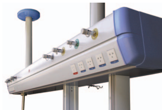
Tomadas elétrica universal 2P+T ou tripolar, conexões internas conforme norma ABNT NBR 5410:2004 e fios de 2,5mm.

Pontos de gases: corpo confeccionado em latão cromado com rosca padrão para o gás correspondente com pino de impacto, evitando vazamento fora de uso. As rosca dos pontos de gás são normatizadas de acordo com a ABNT NBR 11906:1992. A identificação dos gases é feita através de etiquetas com cores normatizadas conforme ABNT NBR 12188:2003. Tampão de PVC para proteção das rosca das conexões. Tubulação interna realizada através de mangueiras em poliuretano, devidamente identificadas pela cor conforme normas vigentes.