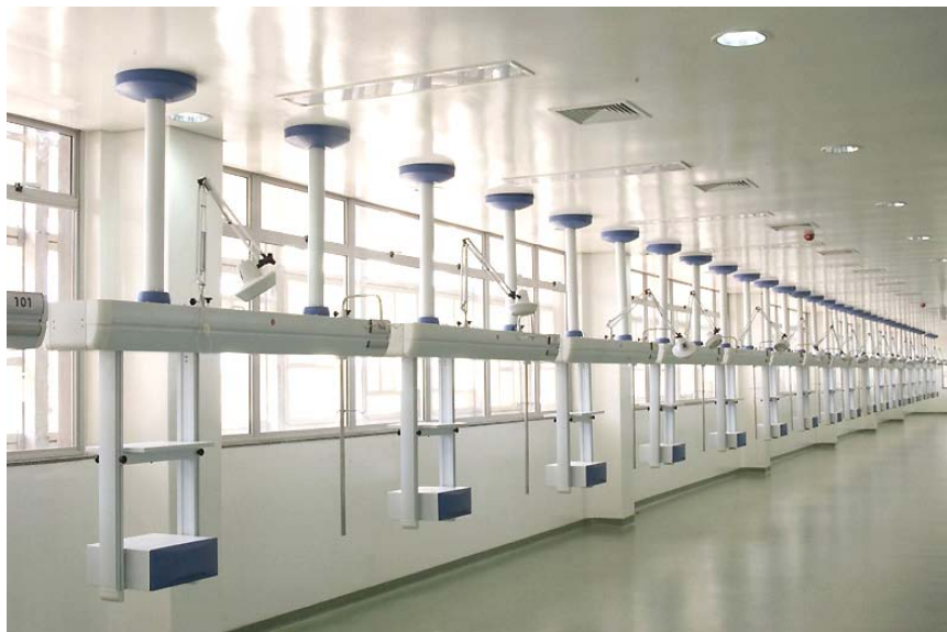
Projeto conforme a necessidade do cliente

Os painéis Linha Delta têm como função direcionar a alimentação elétrica e de gases próximo aos equipamentos que estarão sendo utilizados dentro de uma unidade de terapia intensiva, tais como ventiladores pulmonares, monitores de sinais vitais, bombas de infusão, etc. A forma construtiva do produto permite melhor distribuição destes equipamentos, além de permitir ao usuário mobilidade, ergonomia, facilidade no manuseio e conseqüentemente agilidade nos procedimentos.