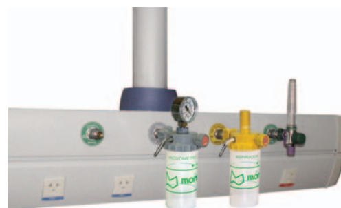
Caixa com ponto de gases e tomadas elétricas para acoplar acessórios de gasoterapia como: Fluxômetros, Aspiradores, Umidificadores, Nebulizadores, etc.